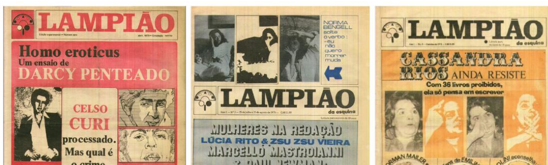
Figura 3 – Lampião da Esquina nº 0, 3 e 5.

Para que o leitor gay e lésbico brasileiro tivesse mais conhecimento do patrimônio literário que contava de seu cotidiano o jornal Lampião da Esquina se dispôs a mediar a informação sobre livros e autores(as) escritos e inscritos(as) dentro da cena homossexual brasileira no período de abertura política da Ditadura Militar brasileira, entre 1970 e 1980. O desbunde sobre as sexualidade e a literatura para pessoas gays foi pauta do jornal desde a sua primeira capa, em edição experimental (Figura 3), em que anuncia Darcy Penteadado (1926-1987 – paulista de São Roque), Celso Curi (1952 – paulistano de São Paulo) e Garcia Lorca (1898-1936 – espanhol de Fuente Vaqueros, Espanha). O número três trouxe na capa Norma Bengell (1935-2013 – carioca do Rio de Janeiro). Na edição de outubro de 1978 o Lampião da Esquina trouxe em sua capa Cassandra Rios (1932-2002 – paulistana de São Paulo).