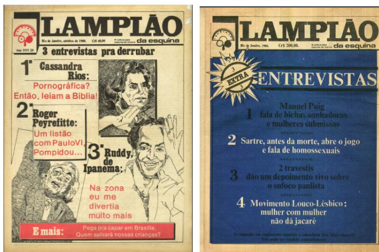
Figura 5 – Lampião da Esquina nº 29 e Extra 3.

No número 29, já no terceiro ano do Lampião da Esquina , estampa em sua capa a travesti Ruddy Pinho (1944-2021 – belo-horizontina de Minas Gerais). Em sua terceira edição extra de 1980 o nome de Manuel Puig (1932-1990 – espanhol de General Villegas, Argentina) estampa a primeira página, logo abaixo é anunciada entrevista dada pelo parisiense Jean-Paul Sartre (1905-1980), o filósofo fala à Gai Pied sobre homossexualidade e as masculinidades forjadas pela heterossexualidade compulsiva (Figura 5)