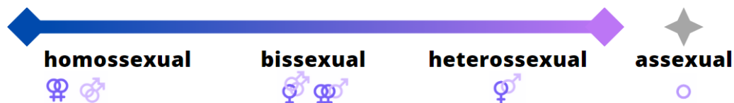
Figura 1 – espectro da orientação sexual.

mulheres / mulheres por homens), por ambos os sexos (homens por homens e mulheres / mulheres por mulheres e homens), pelo mesmo sexo (homens por homens / mulheres por mulheres) e não sentem atração sexual (Figura 1).