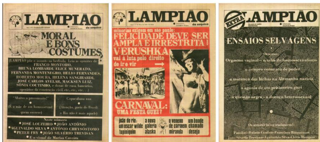
Figura 4 – Lampião da Esquina nº 9, 10 e Extra 2.

Na capa do número 10 (Figura 4) o autor João do Rio (1881-1921 – carioca do Rio de Janeiro) é comparado com Oscar Wilde (1854-1900 – irlandês de Westland Row). E no segundo número extra do jornal temos Francisco Bittencourt (1933-1997 – gaúcho de Itaqui).