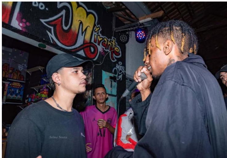
Roda de Rima da ZN, no Complexo do Alemão. (Batalha de rimas Mauãzin x Ben), 2022