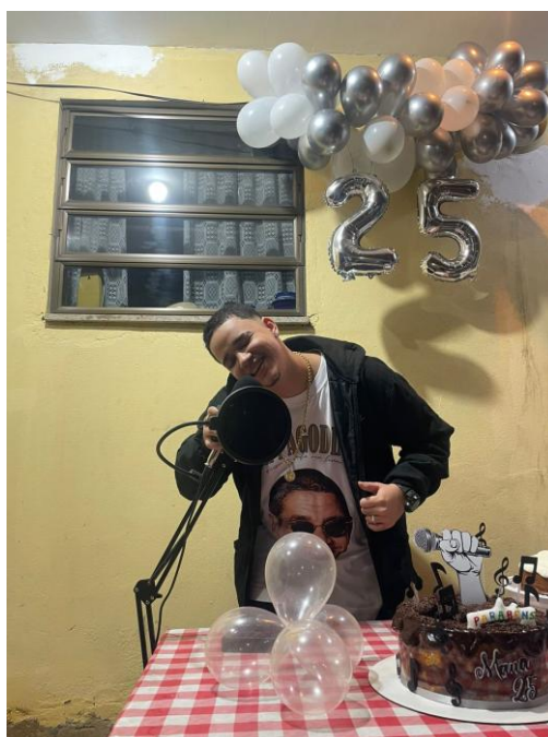
Aniversário de 25 anos, set/2025