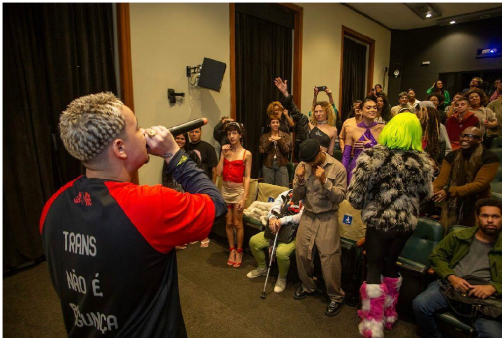
Apresentação no projeto Transcineclube, no Centro Cultural Justiça Federal, 2025