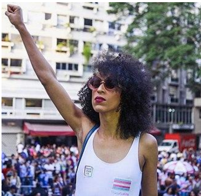
Érika Hilton na Marcha do Orgulho Trans , em SP, 2019

Projetos como o Slam das Minas, do qual fiz algumas apresentações a convite de meu amigo Tom Grito, foi criado para que mulheres e pessoas trans pudessem se expressar sem censura, transformaram a poesia em espaço de acolhimento e poder. Ali, cada verso é um grito coletivo contra a violência, contra o patriarcado, contra a transfobia. O TransCineClube é uma iniciativa que une cinema, performance e ativismo trans, ocupando espaços culturais antes negados a esses corpos. A última edição aconteceu no Centro Cultural Justiça Federal, na Cinelândia, onde, mais um ano, me apresentei com um show de rap. Para muitos, pode ter sido apenas um show de rap, assim como para muitos, no início, os discursos da Erika eram apenas discursos. Mas enquanto eles pensam que falamos apenas baboseiras, várias pessoas começam a ir discordando deles, por perderem no argumento, tudo isso gera algo muito maior.