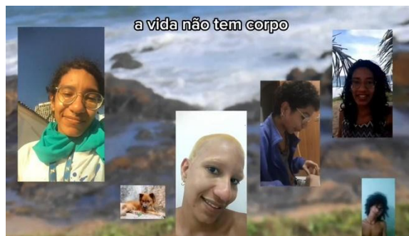
Figura 5 Ser Vida! Captura de Tela. Autora Rosa Catão Cruz

observada com encantamento e inspiração. Como deusas que sempre fomos, em um caminho de imersão e estudo das nossas corporalidades e vivências pré-coloniais.