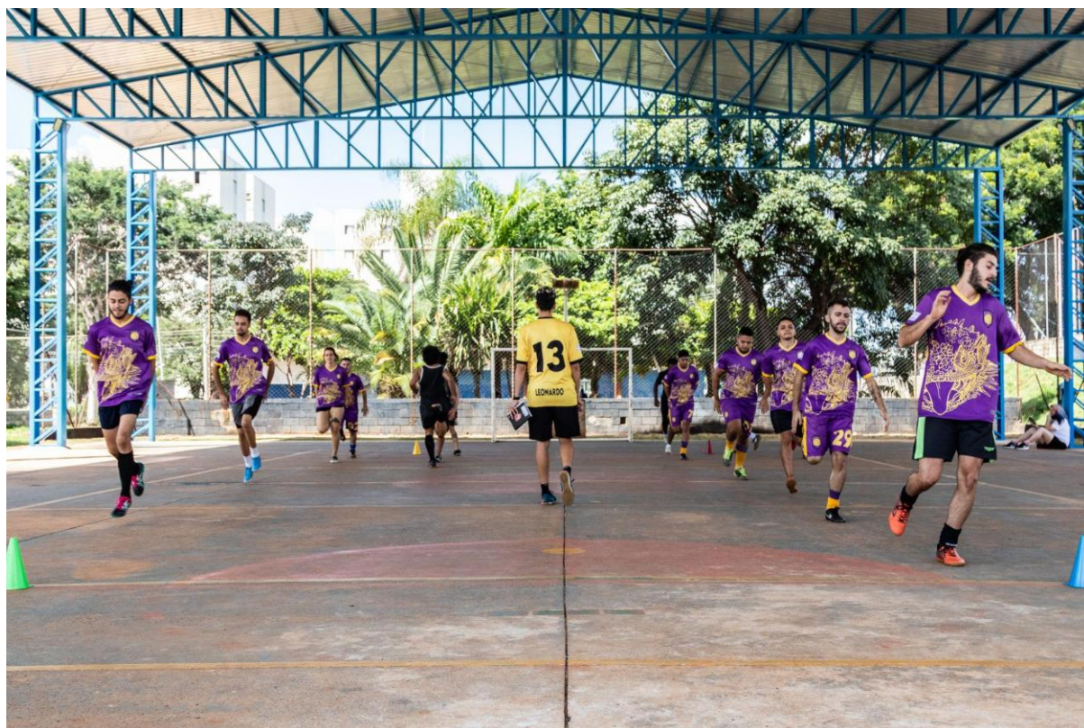
Treino do Pogonas com o primeiro modelo dos uniformes, quadra pública no bairro Costa e Silva (2022)

com outros coletivos esportivos e a população da cidade que busca nas quadras uma forma de lazer. Na mesma época, treinando com materiais simples comprados coletivamente, em 2022 o time participa do seu primeiro campeonato. Desenham eles próprios um uniforme que financiam através de apoio voluntário e revenda de refrigerantes na porta dos restaurantes universitários da UNICAMP e, trajados de roxo e amarelo (cores não tipicamente associadas ao feminino nem ao masculino), conquistam o terceiro lugar.