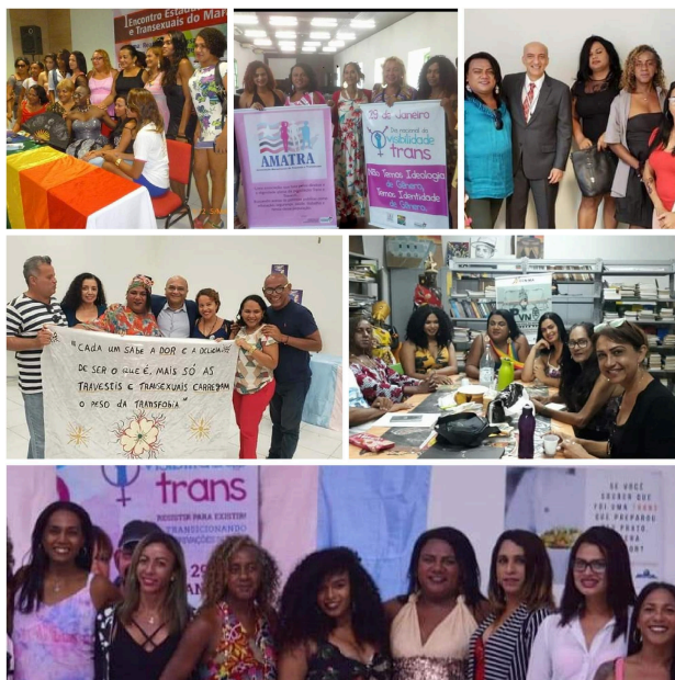
Figura 3 – Ações da AMATRA