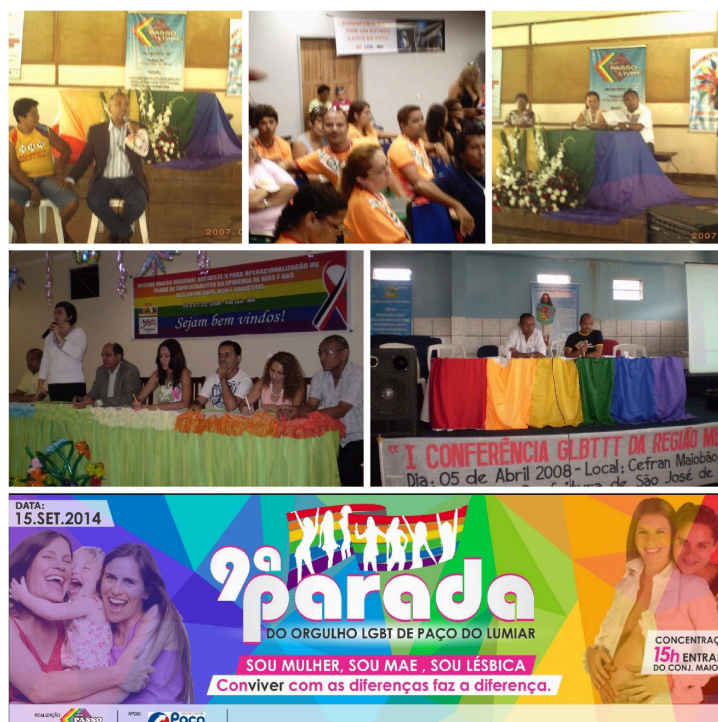
Figura 4 – Ações do Grupo Passo Livre de Paço do Lumiar