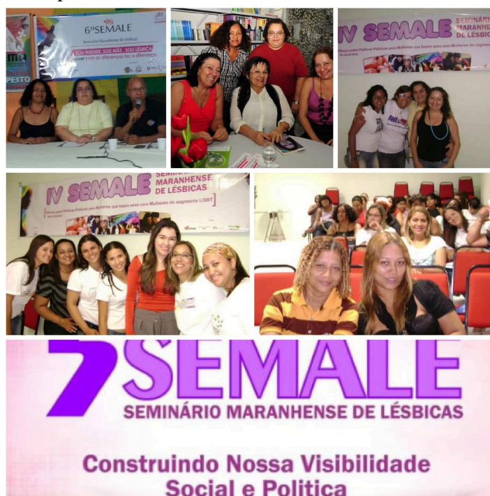
Figura 2 – Ações do Grupo Lema